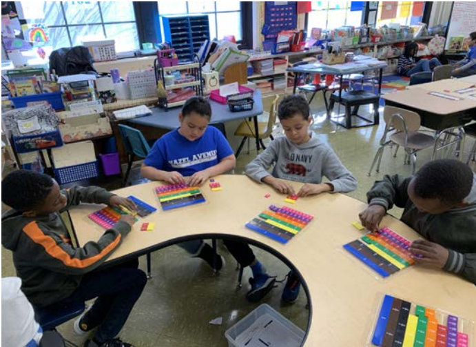
Third graders working with math fraction tiles Estudiantes de 3ro grado trabajando con losetas de fracciones