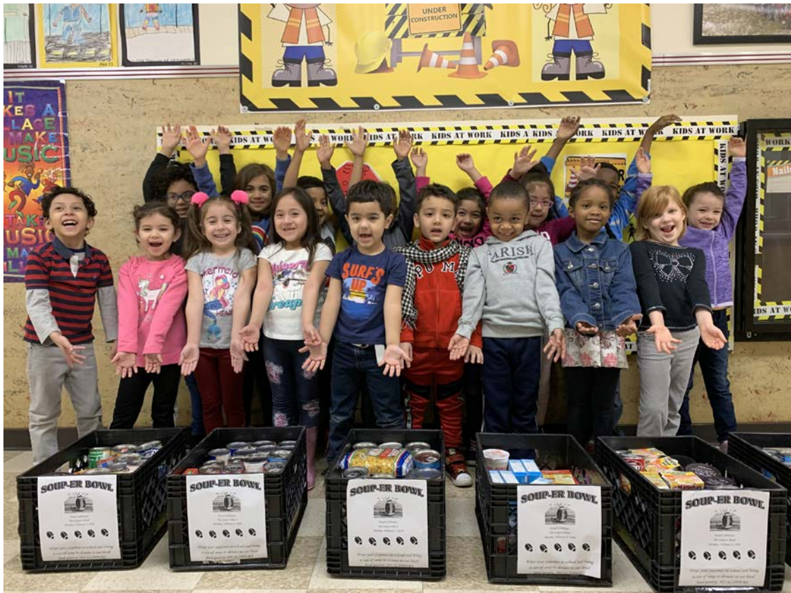
Look at all the soup cans we collected for our yearly Soup-er Bowl!! Mira cuantas latas de sopa fueron donadas en nuestro Soup-er Bowl anual.

Hazel School, Where We Build Good Character Every Day Escuela Hazel, Donde Construimos Buen Caracter Cada Dia