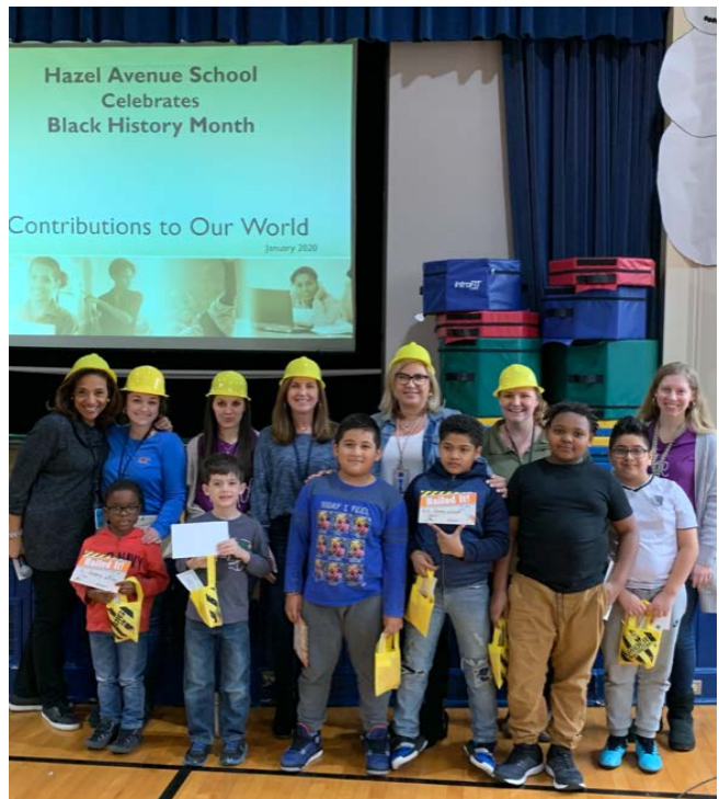
Whole School Meeting Character Winners Los ganadores de la reunión mensual de la escuela entera