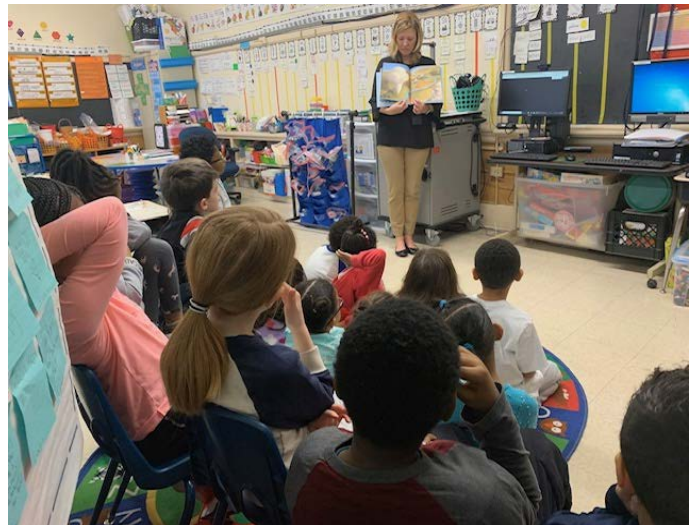
World Read Aloud with first graders on Skype with an author 1ro hablando remotamente con un autor en el día mundial de lectura