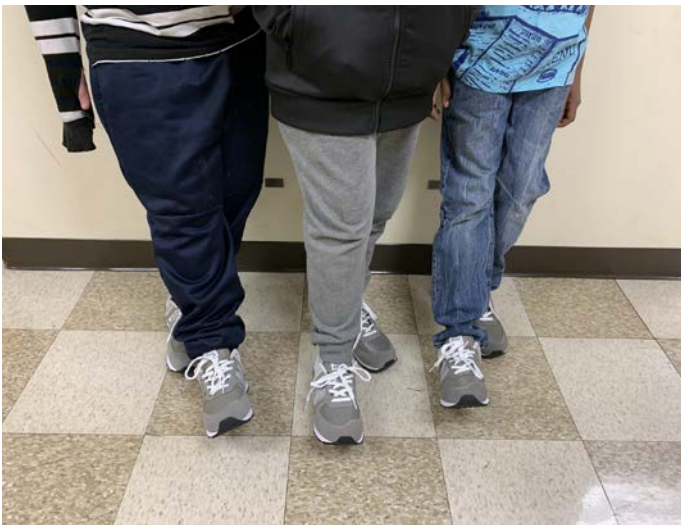
Proud recipients of the Shoes that Fit and Nordstrom donations Recibimos estas donaciones de Shoes that Fit y Nordstrom