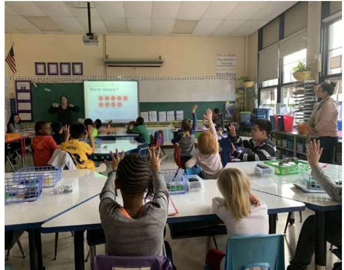
Fourth graders practicing how to make 10 with Kindergarteners Estudiantes de 4to practicando con los de kinder como hacer 10